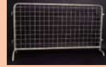
TRANSENNA A MAGLIE