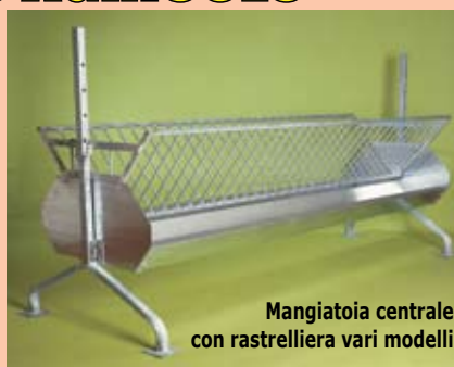
Mangiatoia centrale con rastrelliera vari modelli