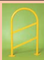
DISSUASORE DI SOSTA SALVAPEDONI