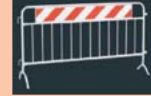
TRANSENNA CON FASCIA RIFRANGENTE