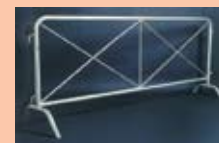
TRANSENNA A INCROCIO