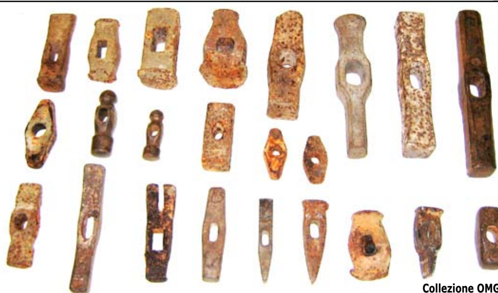
Collezione OMG, martelli

Le cose cambiano, una volta sposati. Appena mi sono sposata, andavo in giro per casa senza vestiti addosso. Mio marito diceva sempre: "Baby, sei stupenda. Vieni qui". E non poteva levarmi le mani di dosso. Adesso, quando giro per casa senza vestiti, lui mi dice: "Stupida, non hai freddo a stare così?".